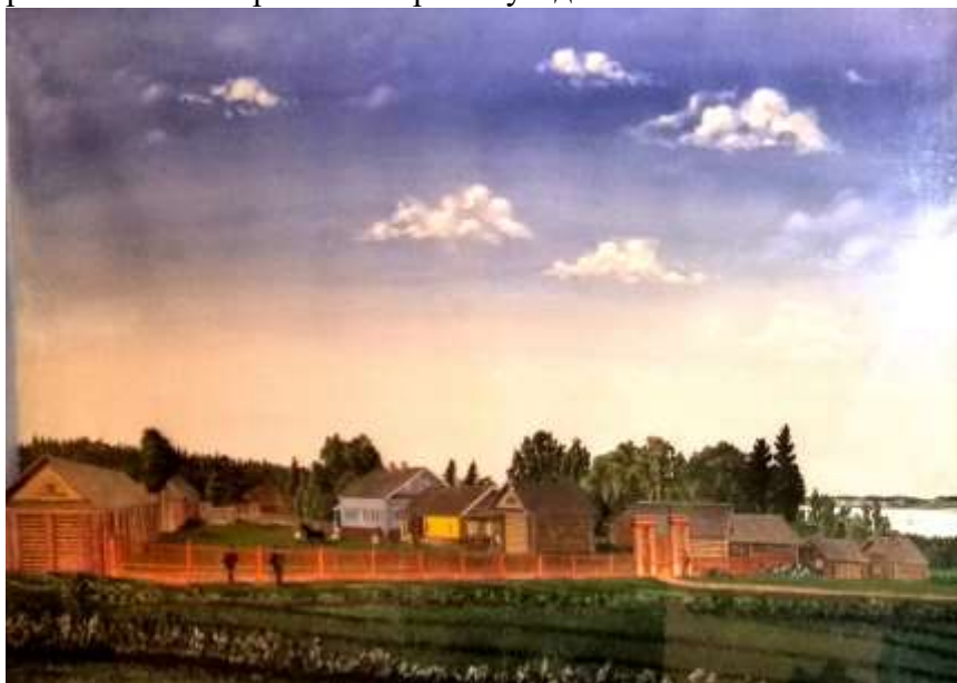
Диорама «Усадьба села Сырково». Галичский музей. Востановлена Н.Сотниковым

Рядом с церковью стояла красивая барская усадьба.