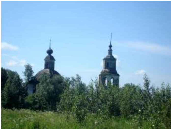
Так выглядит церковь Рождества Богородицы в настоящее время