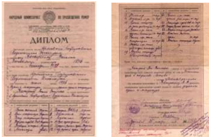
Диплом об окончании Ярославского Государственного педагогического института

Институт был окончен с оценками хорошо и очень хорошо и только по предметам, связанным непосредственно с политикой – Ленинизм и Мировая политика эпохи феодализма и промышленного капитализма – были оценены удовлетворительно.