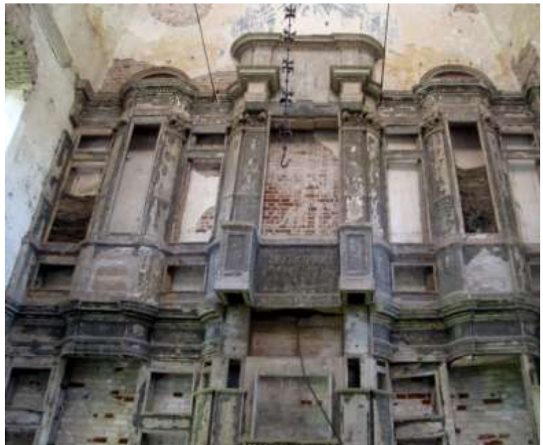
Резные Царские врата и остатки иконостаса (70-е годы XX века) церкви Рождества Богородицы в селе Сынково.